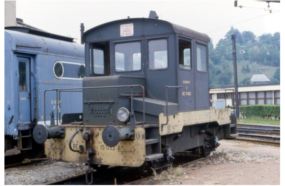
Le YBE - 15053 en service à Chambéry en 1981

Le YBE - 15053 est sauvegardé par l'APMFS ( www.apmfs.fr ) à Chambéry.